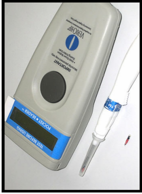
Les outils pour vous « pucer » : la micro-puce, la seringue hypodermique et le lecteur/scanner

La micro-puce sous-cutanée pour humains est une petite capsule un peu plus grande qu'un grain de riz, contenant des éléments électroniques et que l'on vous glisse sous la peau grâce à une seringue hypodermique, le tout sous anesthésie locale. La même méthode est déjà appliquée aux animaux !