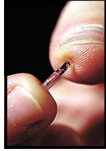
La taille réelle de la micro-puce sous-cutanée pour humains

Le but de ce dépliant est de vous informer et de vous faire comprendre qu'il ne faut vous laisser implanter sous AUCUN prétexte !